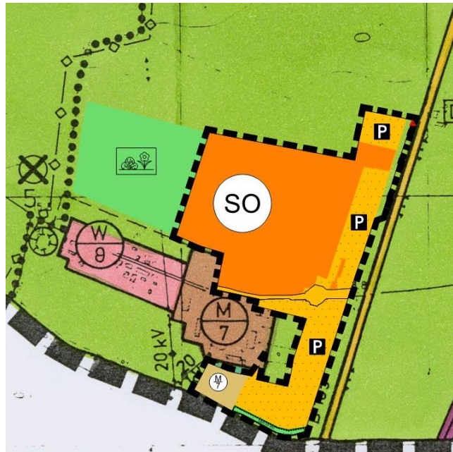
7. Änderung des Flächennutzungsplanes