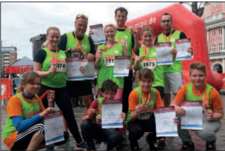
Das Laufteam der JFw Mönchhagen