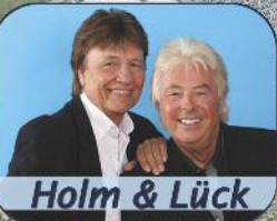
Holm & Lück