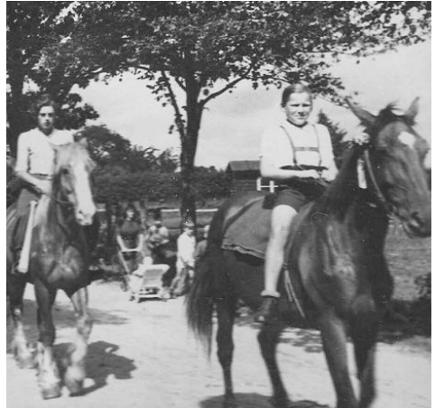
Dorrfest in Bentwisch, Sommer 1950

Jedes Jahr im Herbst wurde in der Gaststätte zur Deutschen Eiche ein Schauspiel für die Dorfbewohner vorgeführt. Mit der Machtübernahme der Nazis löste sich der Plattdeutsche Verein auf.