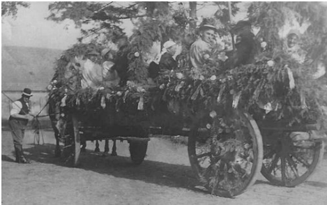
Plattdeutscher Verein aus Bentwisch aus dem Jahre 1931

Was für den einen die Sprache, ist für den anderen das Foto. Es ist für alle leicht zugänglich. Viele Erinnerungen werden wach und die Sehnsucht nach alten Zeiten bringt einen ins Schwelgen. Oder wir belächeln die Bilder aus vergangenen Tagen und legen sie schnell beiseite. Auf jeden Fall ermöglichen fotografische Abbildungen eine schnelle und interessante Zeitreise. Seit etwa Mitte des 19. Jahrhunderts bereichert diese Art der Dokumentation die Kunst der Malerei. Von der Gemeinde Bentwisch und ihren Ortsteilen sind gegenwärtig in meinem Archiv die frühesten Fotos gegen Ende des 19. Jahrhunderts vorhanden. Wie sich der Ort mit seinen Bewohnern zu dieser Zeit präsentierte, wird durch einige ausgewählte Fotos eindrucksvoll sichtbar.