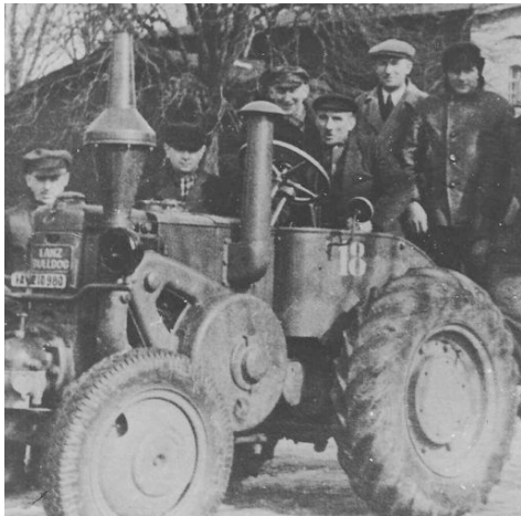
Hier ein Lanz Bulldog, von den Bauern und Neubauern eifrig umringt, Foto aus den 50er Jahren

Die wenigen Traktoren, die den Bauern nach dem verlorenen Krieg noch blieben.