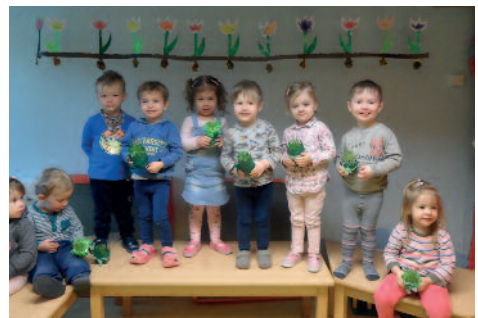
Frühlingserwachen bei der Seepferdchengruppe

In der Natur lässt der Frühling auf sich warten. Bei uns in der Kita ist er längst willkommen! Die »Seepferdchen« haben die Ärmel hochgekrempt und mit toller Unterstützung der Eltern den Gruppenraum zur Frühlingswiese gezaubert. Alle Kinder brachten Kresse – und Grassamen, Behälter und Blumenerde mit. Kleine grüne »Wiesen« entstanden. Unsere 2- bis 3jährigen Kinder konnten jeden Tag beobachten, wie aus einem kleinen Samen eine Pflanze wird. Täglich wurden sie gegossen und gepflegt. Auch Tulpen schmückten nun den Gruppenraum. Aus einer Bilder Geschichte erfuhren die Kinder, dass aus einer kleinen Blumenzwiebel im Frühling eine wunderschöne Tulpe wächst. Mit Pin-