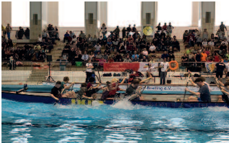
Es hat allen viel Spaß gemacht

nem riesengroßen Drachenboot und kämpften um das schnellere Ankommen am Beckenrand. Auch unser Team war international besetzt – aus der Ukraine, Syrien, Polen und Deutschland. Wir gaben unser Bestes, paddelten, spritzten und ... waren dabei!!! Im Anschluss waren im Marmor-saal noch verschiedenen Trainingsgeräte aufgebaut, ein Rollstuhl-Parcours lud ein zum Ausprobieren. Es hat uns allen Spaß gemacht, und wir werden für das nächste Drachenbootrennen trainieren.