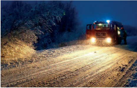
Beseitigung eines Baumhindernisses auf der B105

Mit den dann ansteigenden Temperaturen kam das Schmelzwasser und verwandelte nicht nur Straßen in Bäche, sondern flutete auch Gebäude und verschaffte der FFW Mönchhagen drei Einsätze, einer davon betraf gleich vier Gebäude im Unterdorf in Mönchhagen.