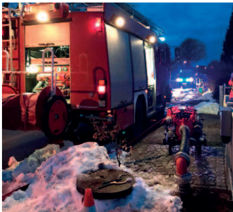
Der schmelzende Oster-Schnee setzte mehrere Keller unter Wasser.

Mit den dann ansteigenden Temperaturen kam das Schmelzwasser und verwandelte nicht nur Straßen in Bäche, sondern flutete auch Gebäude und verschaffte der FFW Mönchhagen drei Einsätze, einer davon betraf gleich vier Gebäude im Unterdorf in Mönchhagen.