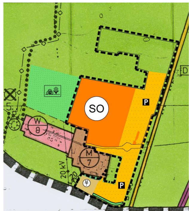
7. Änderung des Flächennutzungsplanes