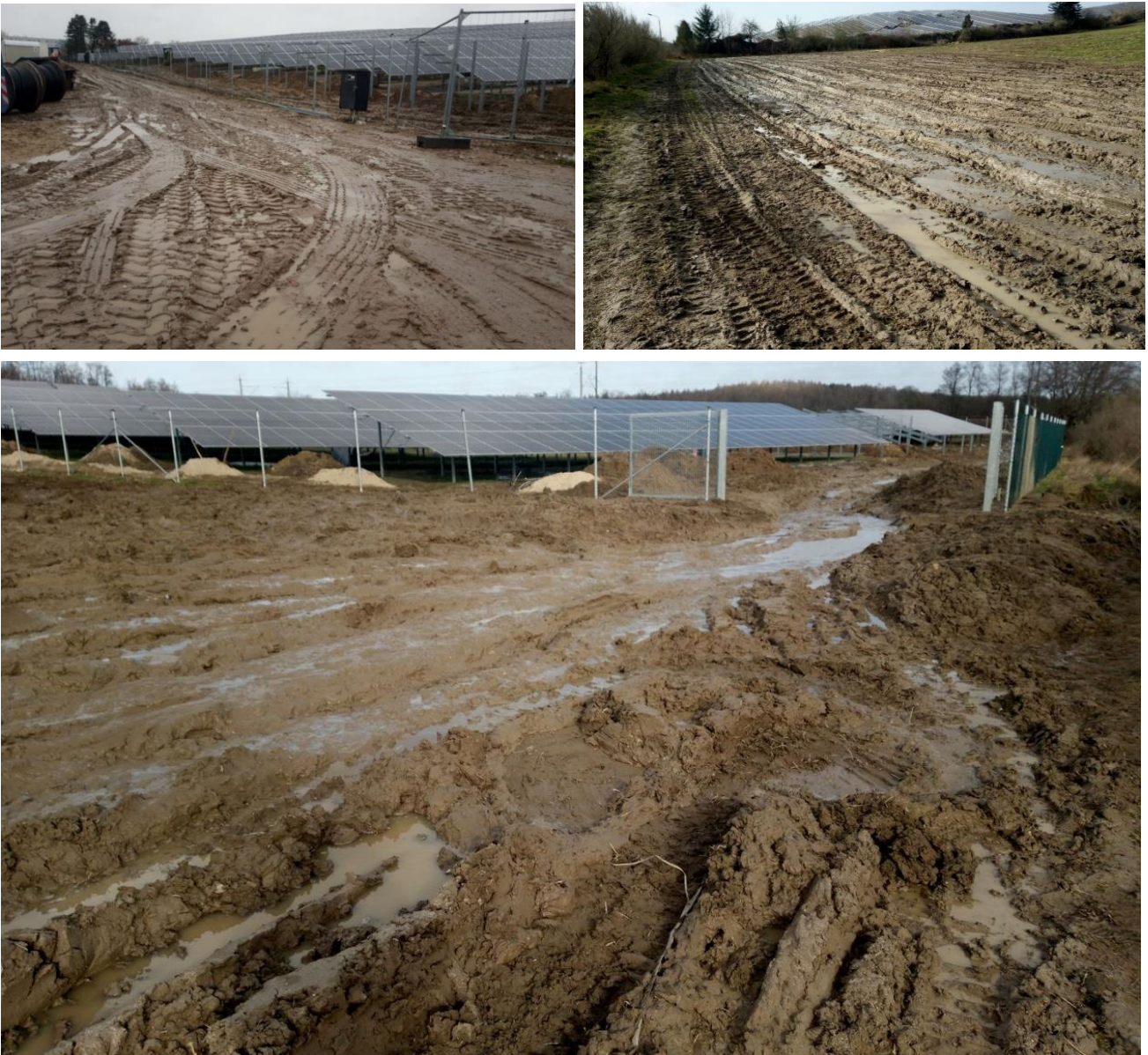
Foto 1-3: Befahrung ungeschützten Oberbodens bei ungeeigneter Witterung/Bodenfeuchte führt zu Schädigung des Bodengefüges und schränkt die Funktionsfähigkeit des Bodens ein

Für freiwillige Naturschutzmaßnahmen bieten sich an: