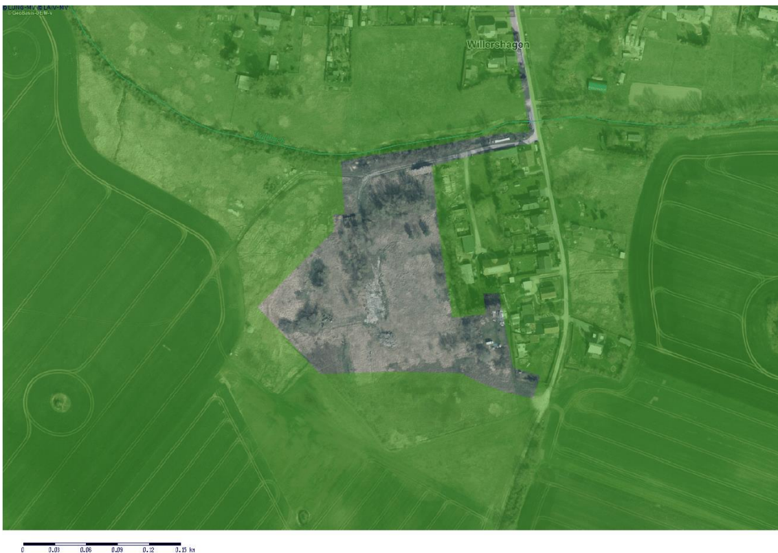
Abbildung 5: Das Plangebiet ist (im Gegensatz zur übrigen Ortslage) weitestgehend aus dem LSG herausgelöst. Kartengrundlage: Kartenportal Umwelt MV 2022.