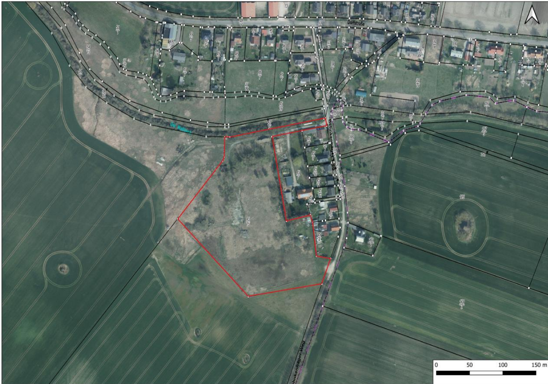
Abbildung 2: Räumliche Lage des Vorhabengebietes in Willershagen, rot = Lage des Plangebietes. Kartengrundlage: Topografische Karte Geoportal M-V 2022.

Das Plangebiet grenzt östlich an die bestehende Wohnbebauung von Willershagen an, nördlich verläuft der Wallbach, südlich und westlich befinden sich landwirtschaftliche Flächen.