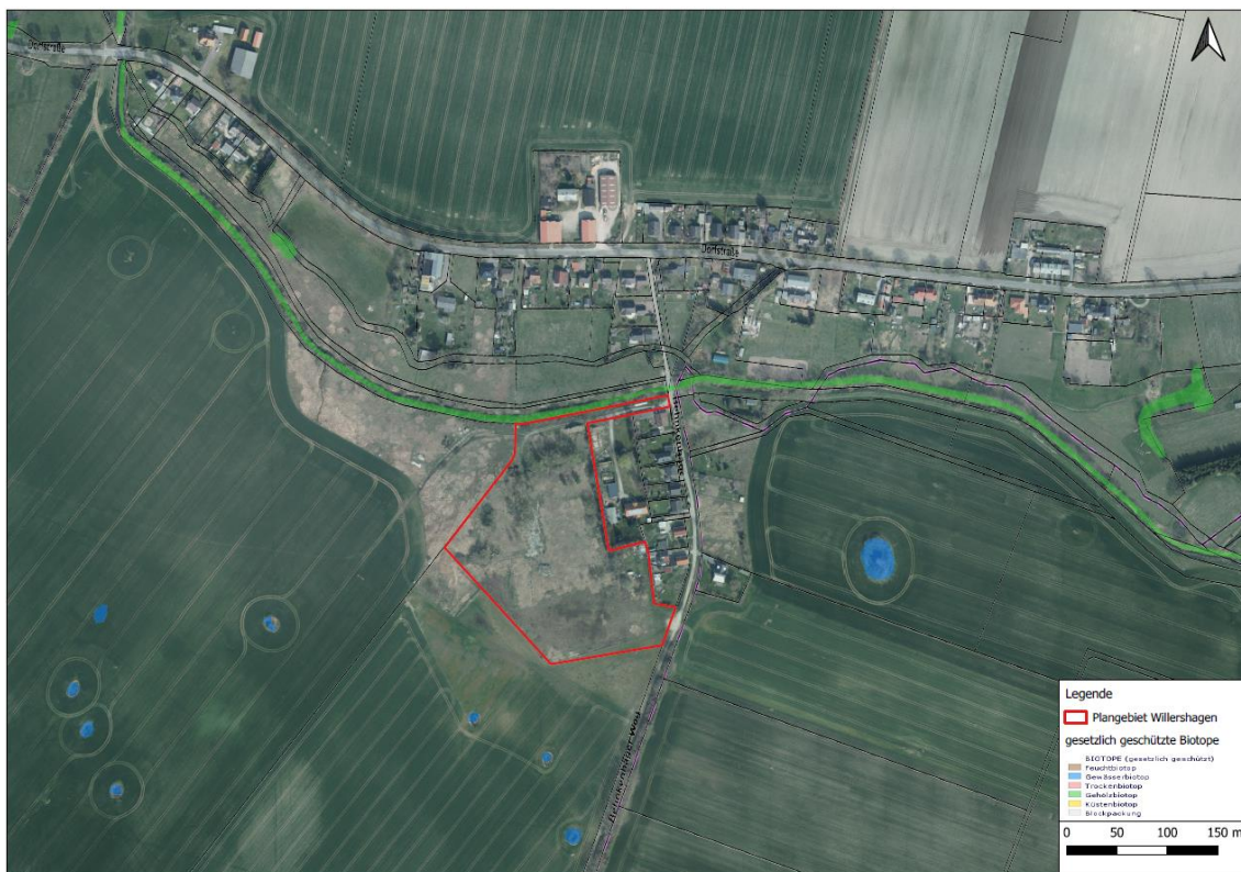
Abbildung 3: Darstellung des Geltungsbereiches (rot) im Zusammenhang mit geschützten Biotopen laut Biotopkataster MV. Luftbildgrundlage: Geoportail M-V 2022.

Abbildung 3 verdeutlicht, dass das nähere Umfeld des Plangebiets von Acker und der bestehenden Wohnbebauung von Willershagen geprägt wird. Innerhalb des Plangebietes befinden sich laut Biotopkataster MV keine gesetzlich geschützten Biotope.