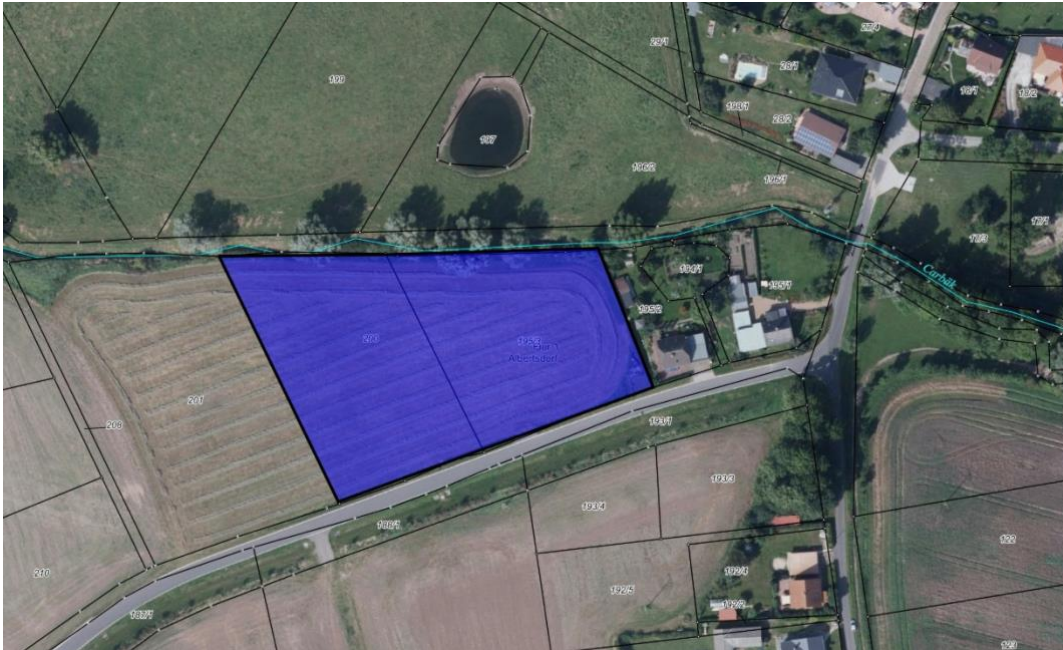
Übersichtskarte, (Quelle: Geo-Portal MV, 11.10.19, bearbeitet durch ign waren GbR am 18.10.19)

Das Plangebiet wird im allgemeinen als landwirtschaftliche Fläche genutzt, aktuell befindet sich auf dem Gebiet eine einfache Wiese.