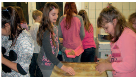
Die fleißigen Bäcker