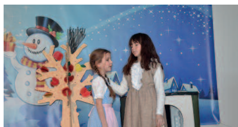
Aufführung »Frau Holle« der Grundschule Bentwisch

als Lohn für ihre Faulheit. Das Ende des Märchens war ein bisschen anders. Es ging auf die heutige Not vieler Kinder ein, die nicht unbeschwert die winterlichen Vergnügen genießen können, weil sie keine warmen Wintersachen haben, hungern oder in Kriegsgebieten leben. Darüber hatte die Pechmarie nachgedacht und wollte daher nicht so oft die Betten ausschütteln, damit es auf der Erde nicht so lange Winter ist. Eine Fassung, die zum Nachdenken anregt. Im Anschluss an den gelungenen Märchnachmittag saßen die Senioren in einem der lichtdurchfluteten Klassenräume, erinnerten sich an ihre eigene Schulzeit und plauderten bei Kaffee und Kuchen. Bereits im dritten Jahr durften Eltern, Erwachsene und Senioren die Märchenaufführungen an der Grundschule miterleben. Wir dürfen somit gespannt sein, womit die Kinder die Erwachsenen im kommenden Winter überraschen werden.