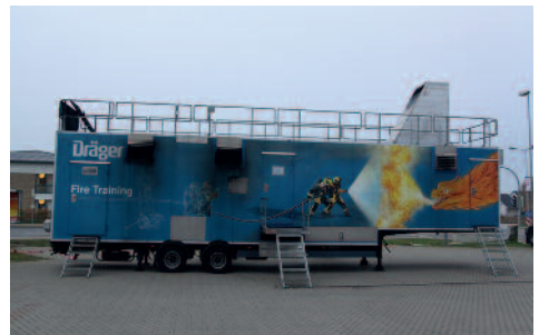
Der Brandübungscontainer von außen ...

Am 5. November trafen sich die Wehren des Amtes Rostocker Heide bei der FFW Rövershagen, um gemeinsam Einsätze in brennenden Gebäuden zu trainieren. Um solche Szenarien möglichst realistisch üben zu können, wurde ein Brandübungscontainer der