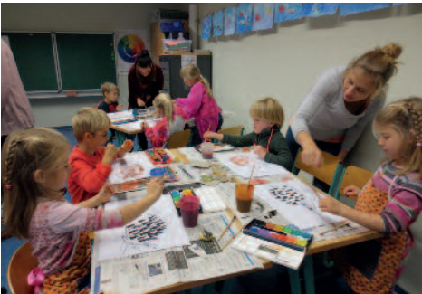
Hier bekommen die Igel lustige Stacheln