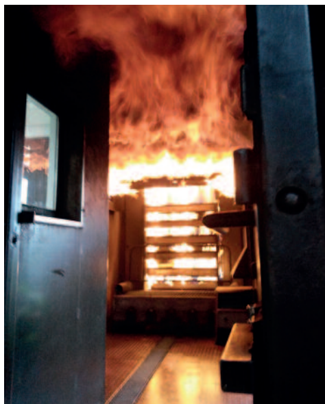
... und von innen