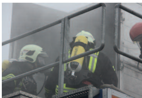
Kameraden betreten das brennende »Gebäude« unter Atemschutz.

send. Für die KameradInnen, die gerade nicht im Übungseinsatz waren, rundete Theorieunterricht die Ausbildung ab.